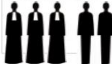
Lawyers for the Prosecution