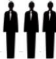
Representatives of States