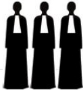
The ICC Judges