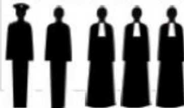
The Accused and Defence Counsel